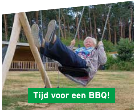
Tijd voor een BBQ!