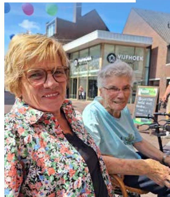
Wandeling naar de stad met een heerlijke kop koffie bij restaurant De Tijd.