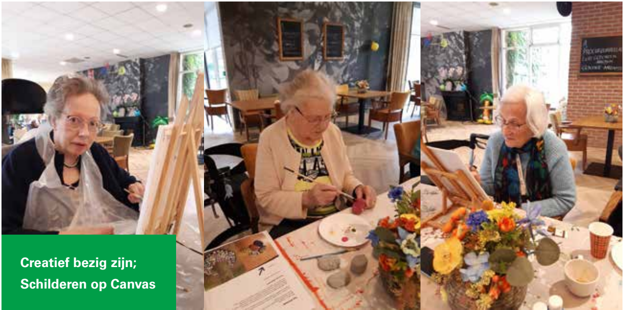
Creatief bezig zijn; Schilderen op Canvas