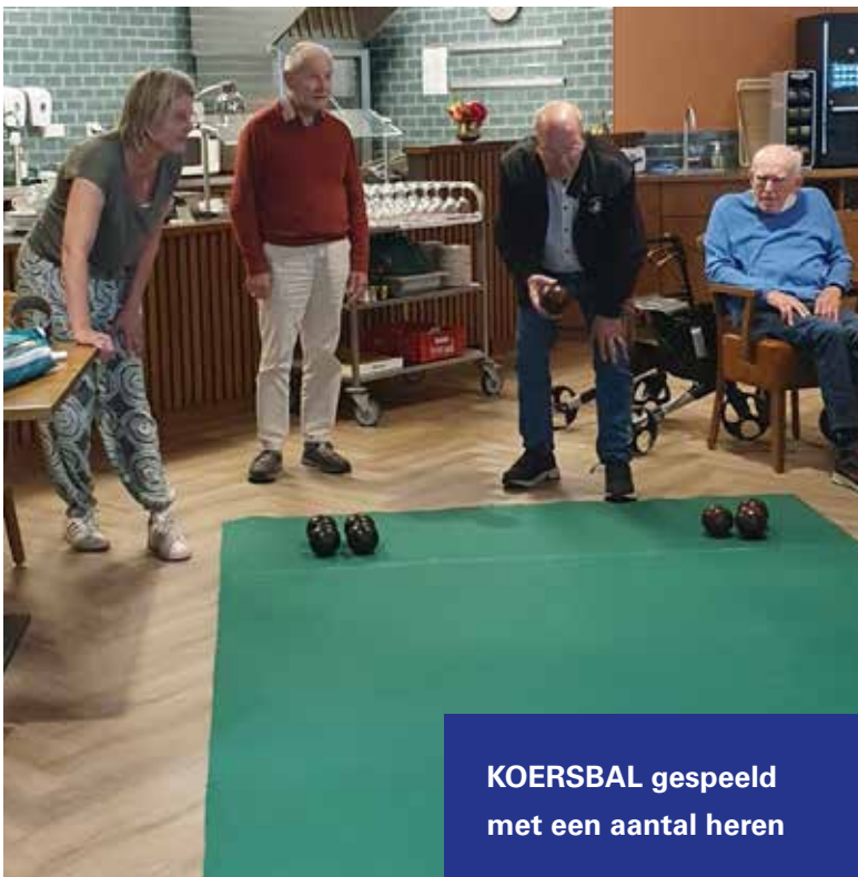
KOERSBAL gespeeld met een aantal heren