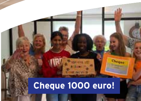
Cheque 1000 euro!