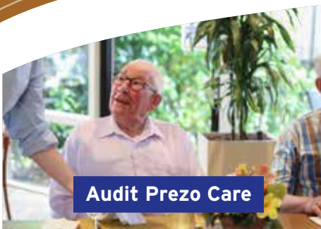
Audit Prezo Care