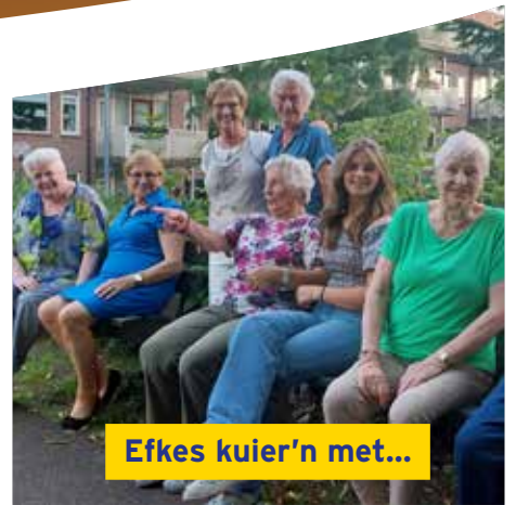
Efkes kuier'n met...