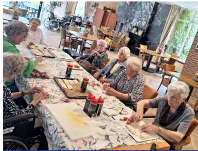
Iedere dinsdag is er een leuke bakactiviteit. Dit keer werden er heerlijke worstenbroodjes gemaakt.

Op maandagmiddag staat er Koersbal voor de heren op het programma van 14.00-15.30 uur. Een actieve middag waar de heren van genieten.