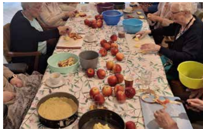
Deze dinsdagmiddag werden er diverse appeltaarten gebakken die uitgedeeld werden op de verschillende afdeling. Lekker smullen!