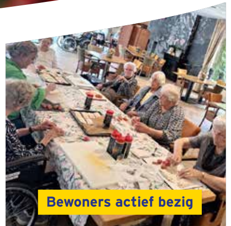
Bewoners actief bezig