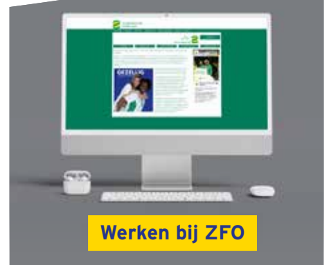
Werken bij ZFO