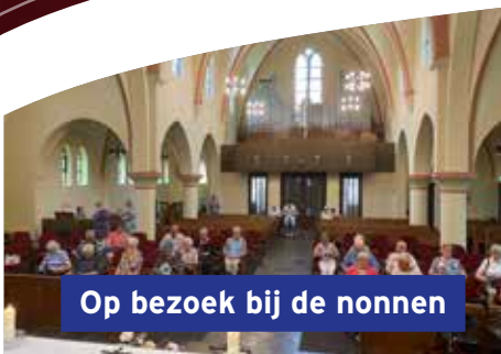
Op bezoek bij de nonnen