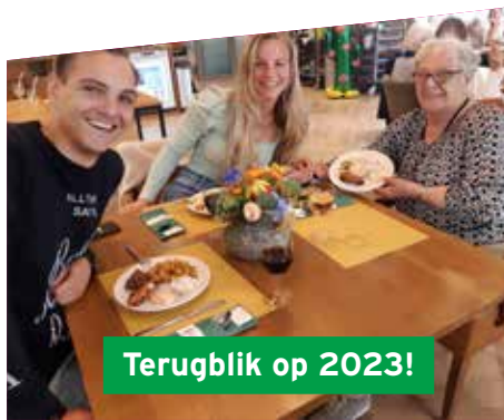
Terugblik op 2023!